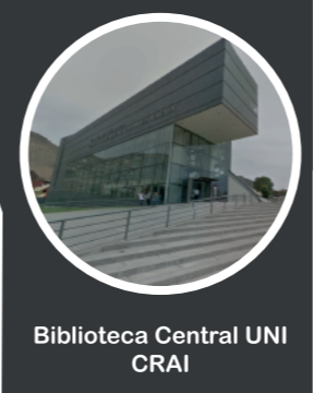
Biblioteca Central UNI CRAI